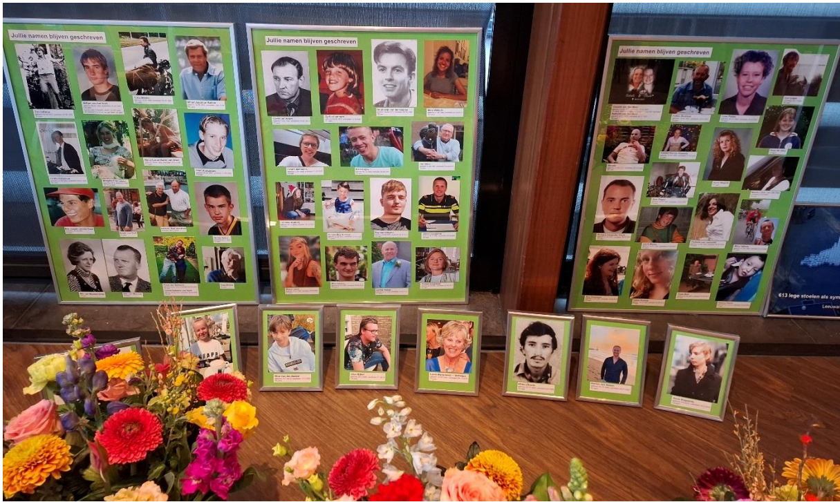
Jullie namen blijven geschreven